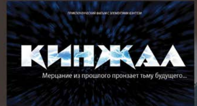
КИНЖАЛ (в производстве)

© 2014-2024 ООО «СИНЕМА КОНЦЕПТ ПРОДАКШН» +7 925 741 8001 info@cc-pr.ru www.cc-pr.ru