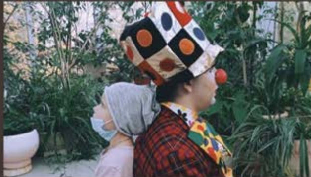
КЛОУН (в производстве)